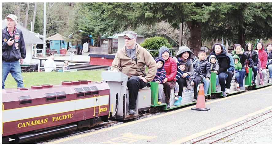
◀▶本那比中央鐵路迷你火車昨日是今年第一天行駛，吸引許多市民前來乘坐。

【明報專訊】本那比中央鐵路（Burnaby Central Railway）的迷你火車昨日開動，由於是復活節長假的首日，一早已吸引許多市民帶着孩子前來乘坐。迷你火車只有八分之一正常蒸汽火車頭大小，行駛在約4公里長的小尺寸軌軌上，有如置身童話故事中，去年總共吸引了7.5萬人次的市民搭乘。