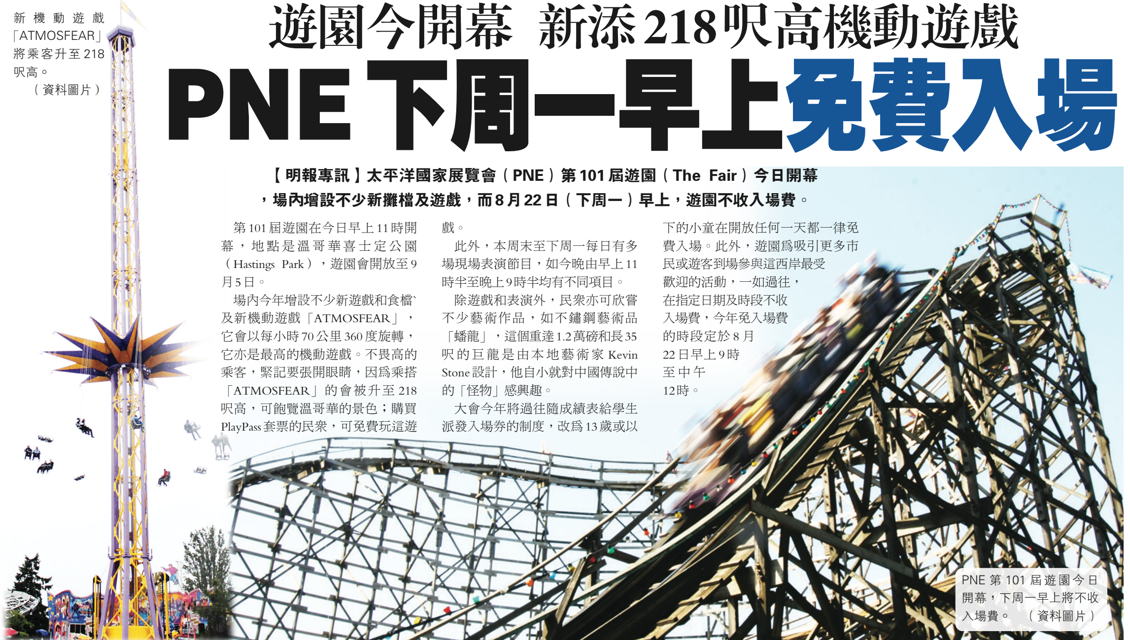
PNE第101屆遊園今日開幕，下周一早上將不收入場費。(資料圖片)

下的小童在開放任何一天都一律免費入場。此外，遊園為吸引更多市民或遊客到場參與這西岸最受歡迎的活動，一如過往，在指定日期及時段不收入場費，今年免入場費的時段定於8月22日早上9時至中午12時。