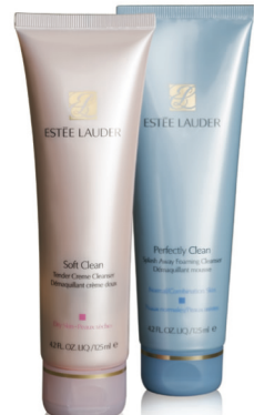
可選擇柔絲滋潤泡沫潔面霜 或全效補濕潔面泡霜

購買任何ESTÉE LAUDER 產品滿$75或以上* 可加選FULL-SIZE 潔面產品一份。