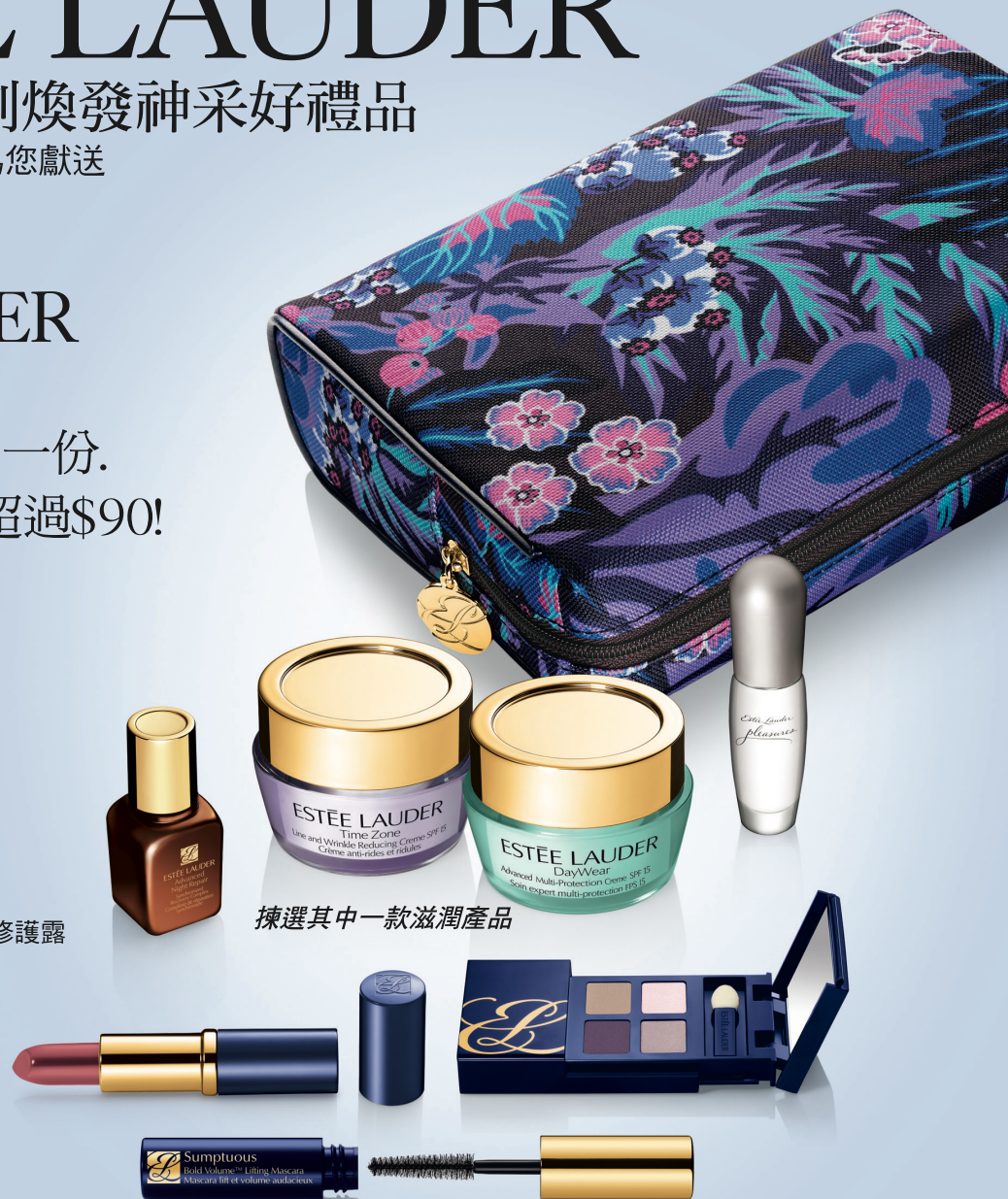
揀選其中一款滋潤產品