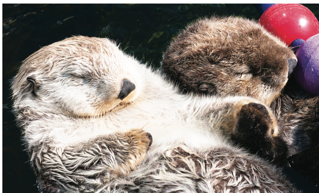
Milo(左)與另一隻海獺Tanu手牽手在水池享受漂浮的樂趣。