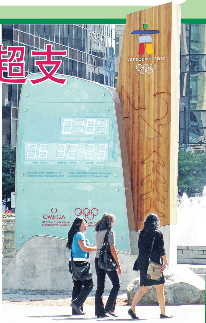
溫哥華藝術館門外的2010冬奧倒數鐘顯示，冬奧倒數已踏入最後6個月。

另一方面，卑詩公民協會稱，他們多次向冬奧綜合保安小組索取冬奧期間的封路資料，但一直得不到回覆，他們會行使資訊自由法，向