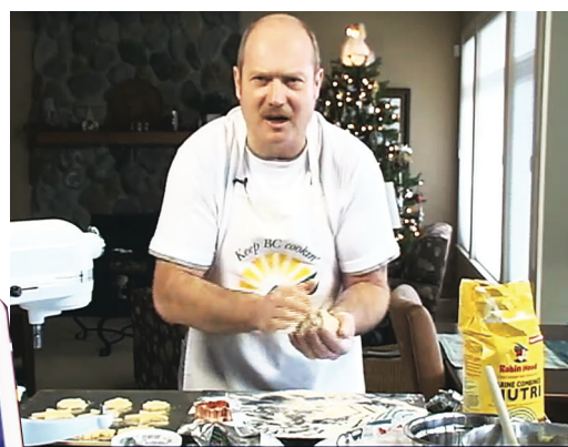
▲麥德莊於競選網站上，放上2段以廚房作背景的錄像，一邊教網民焗曲奇，一邊發表政綱及解答民眾問題。（網上圖片）

已不復見，大多是只買5元的「散客」。他強調，至多彩彩金第一次達到5000萬元時，排隊購買彩票的華裔市民在商場內要排成2排，想不到昨日卻乏人問津。