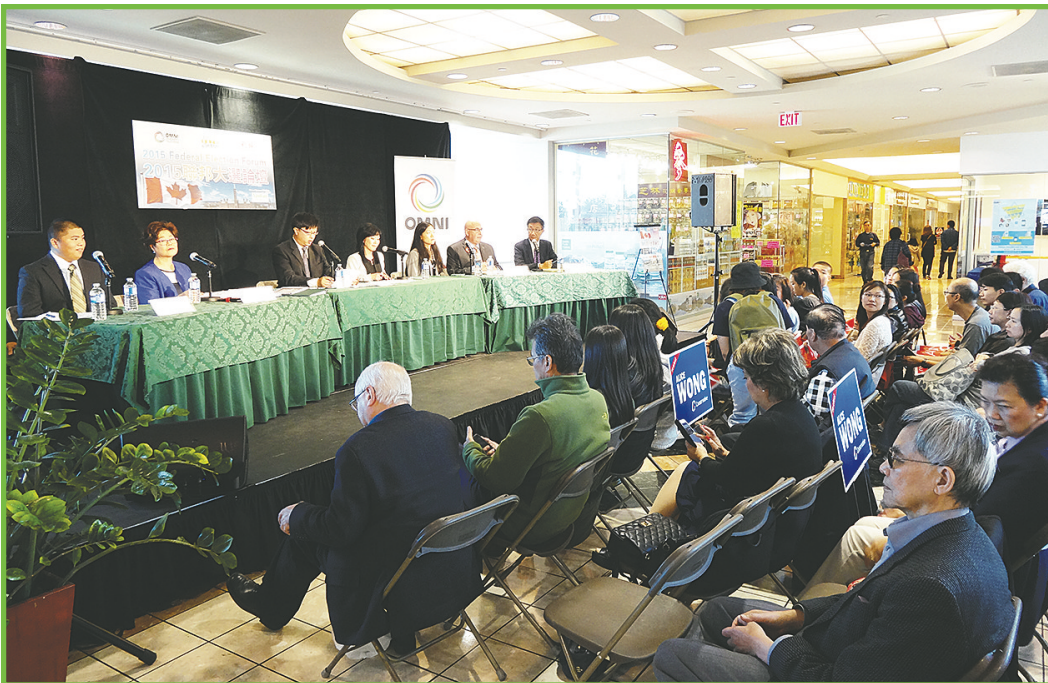
大批市民出席論壇。

【明報專訊】由《明報》、華僑之聲電台、OMNI電視台聯合舉辦的聯邦大選論壇第二場，昨日在列治文八佰伴中心舉行，吸引逾百市民參加。聯邦四大政黨巧合地同時派出列治文中選區（Richmond Centre）的候選人出席，辯論焦點更落在華裔最關注的大麻合法化議題上。