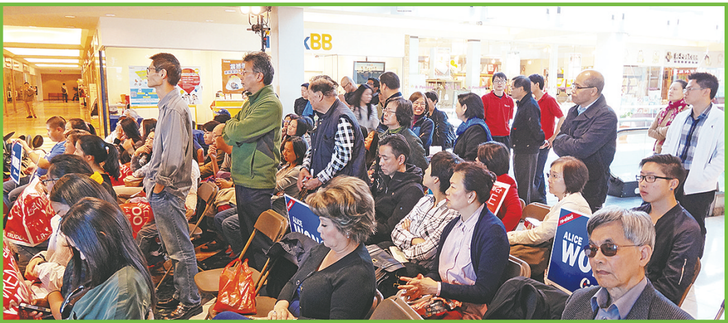
市民排隊踴躍提問。

前來參加辯論會的市民絕大多數爲華裔，因此華裔關注的大麻議題也成爲辯論焦點。在市民提問環節上，半數提問市民的問題皆與大麻有或毒品有關。另外關於安樂死、養老金、政綱是否有中文版、移民政策改進、財政管理、中年人再就業等議題，也有市民提出，但大多是針對保守黨及自由黨提問。