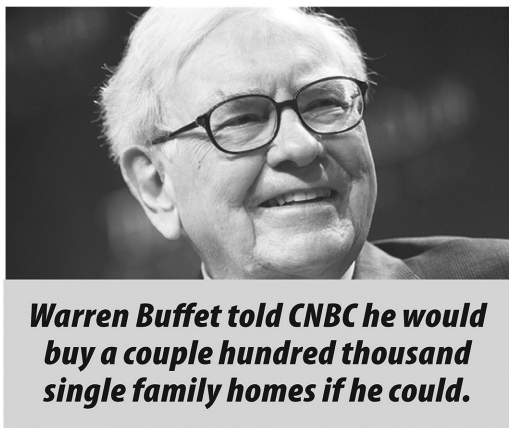
Warren Buffet told CNBC he would buy a couple hundred thousand single family homes if he could.

They will reveal these breakthrough strategies at the FREE events in the Vancouver area. When