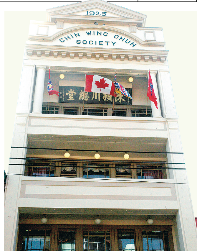
陳穎川堂動用 10 萬元恢復外貌。

卑詩教師聯會表示，該聯會曾與教育廳討論課堂學生人數和特殊需要學生的問題，並會繼續游說省府解決資源的問題。龐雪麗已指出，在入讀學生人數減少下，省府仍增加對學校的撥款。