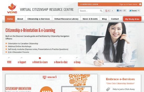
▲ 網站提供充裕的入籍資源，網址為 www.CitizenshipNow.ca