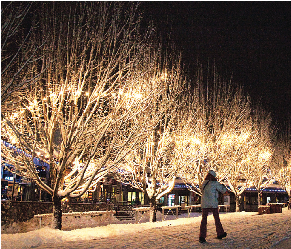
氣象學家估計今年大溫出現白色聖誕機會不高,但威士拿則會有穩定降雪量。圖為威士拿2010年的白色聖誕。

至於阿省、沙省及緬省,預計今冬將受惡劣天氣襲擊,氣溫將低於正常值。另外,瑞斯勒預測威士拿、北岸山脈(North Shore mountains)將有穩定積雪量,大溫今年可迎來滑雪好季節。