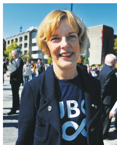
圖)昨日親自加入隊列，與數百名校友共同拼出「UBC100」隊形。她說，卑大在全球120多個國家擁有逾30萬名校友，他們活躍在各個領域，很多校友為社會作出非常突出的貢獻。

卑大校友中包括2名加拿大總理、7位諾貝爾獎得主。卑大教師、校友及研究者還獲得69項羅德學人獎學金(Rhodes Scholarships)及65枚奧林匹克獎牌。