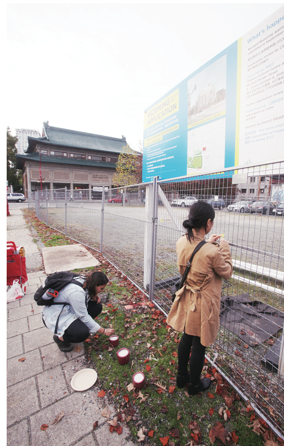
▲「憑弔」人士通過插香與綁繫黃絲帶，表達對華埠「過度」開發的疑慮。