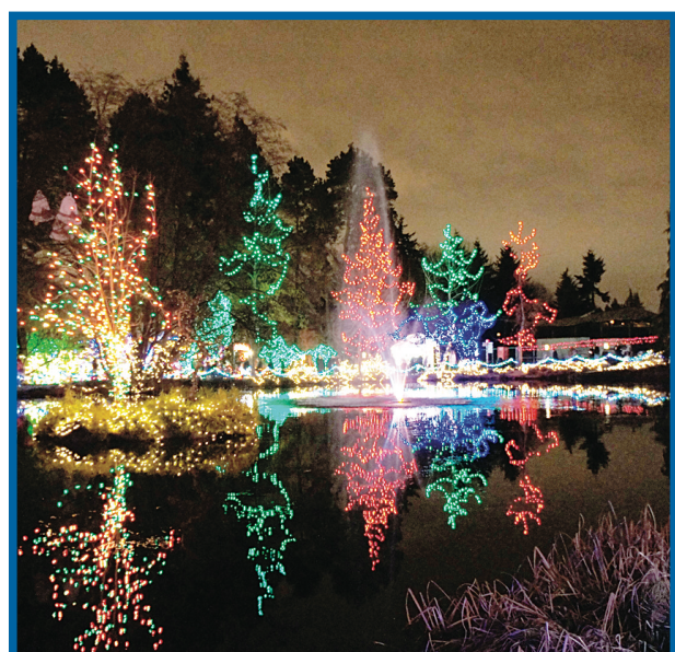
溫哥華范度森植物園的燈節已經亮燈。