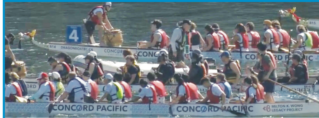
龍舟競渡大賽自疫情以來再之重返溫哥華。（活動截圖）