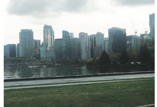
大溫昨日已見烏雲，今日料降大雨，降雨量可高達70毫米。

重現繁榮。 據介紹，舞火龍相傳起源於約140年前的香港，一個小村莊遭颶風、蟒蛇和瘟疫侵襲。村中有長者獲佛陀報夢，於中秋佳節舞火龍繞村遊行可驅疫消災，果然奏效，這個儀式自此流傳至今。