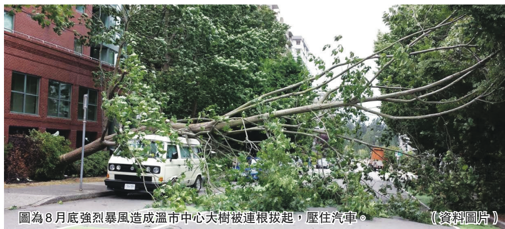
圖為8月底強烈暴風造成溫市中心大樹被連根拔起，壓住汽車。(資料圖片)

民眾可到 www2.gov.bc.ca/gov/content/safety/emergency-preparedness-response-recovery/preparedbc/know-the-risks/floods ，網頁右旁有中文資料下載的連結。