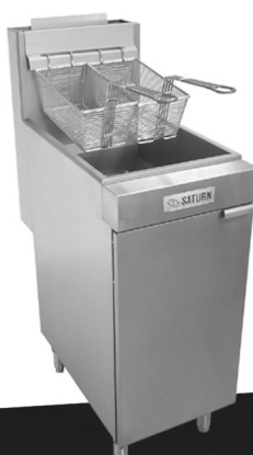
SATURN SAT-SF40 炸爐 Sale Price $899