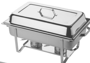
PATRIOT S.S. CHAFER Sale Price $399