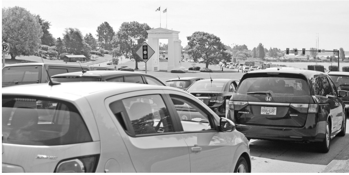
▲和平拱門前大排車龍。

【明報專訊】昨日是加拿大日長周末假期首天，儘管近日加元兌美元匯率下跌，仍有大批省民南下度假和消費，省民在和平拱門關卡苦候過關時間一度逾兩個小時，芳鄰卡線 (Nexus lane) 也要45分鐘，導致邊境附近道路大排車龍。素里騎警鑑於繁忙日常有車輛「打尖」，特別派出騎警打擊違例司機。