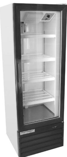
PATRIOT SGMS-10 單門冷藏櫃 Sale Price $949