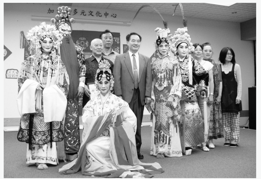
加拿大多元文化中心慶祝國慶，邀請京劇研習社演出，眾人演出前與嘉賓合照。

講座的收入扣除場租等直接開支後，盈餘半數捐作「加華作協」的活動經費，半數捐給葉嘉瑩教授在南開大學的獎學金。講座查詢可電：陳小姐：604-833-8673或604-228-8522。