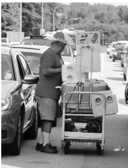
▲流動小販穿梭等候車輛兜售食品。