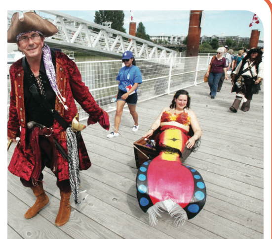
展覽會內有人扮海盜與美人魚。

列治文市在國慶節長周末假史蒂夫斯頓舉辦高桅帆船節展覽等活動，公眾可以免費上船參觀。