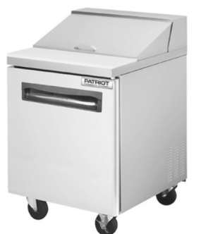
PATRIOT SUSS-27-8 27"三文治櫃 Sale Price $1,465 Other sizes available