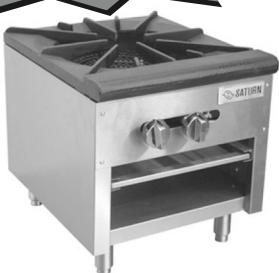
SATURN SHPI-HD 單頭湯爐 Sale Price $615