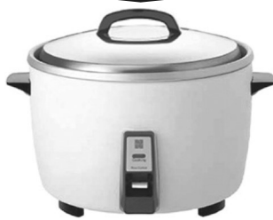
PANASONIC SR-42GHNC 23杯樂聲牌電飯煲 Sale Price $199