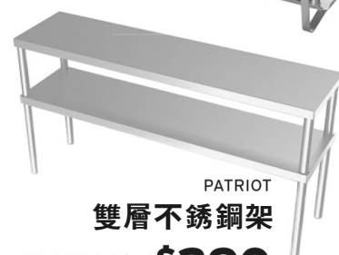
PATRIOT 雙層不銹鋼架 15"x 64" Sale Price $290 Other sizes available