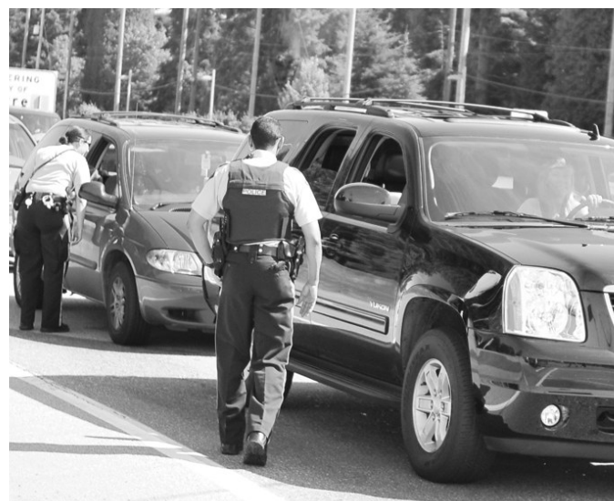
▲騎警檢查芳鄰卡快線司機是否持有芳鄰卡。

一名省民 Brownany 表示，趁長周末假期與妻子和女兒一家四口，南下美國波特蘭 (Portland) 度假三天。早上駕車到達關卡前，已發現有大批車輛正在等候，預計要等兩個小時才能過關。