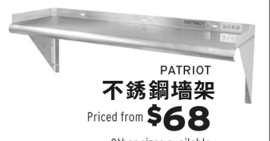
PATRIOT 不銹鋼牆架 Priced from $68 Other sizes available