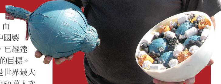
布羅展示煙花炮彈內的炸藥分布，指不同分布方法可帶來不同的發放效果。