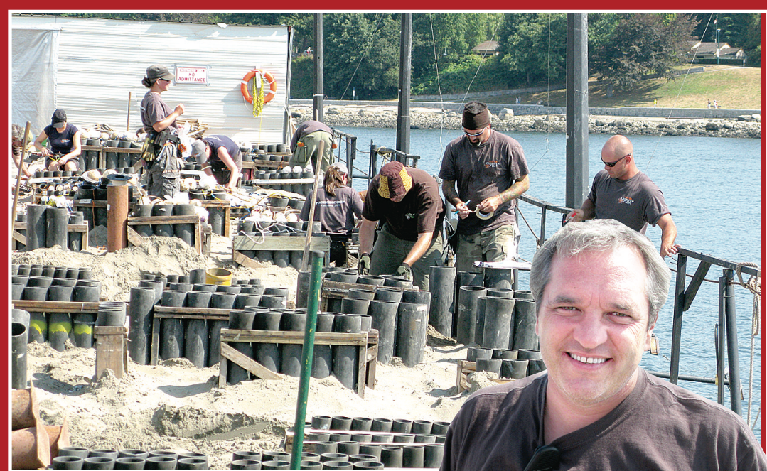
工作人員連日趕工，於多個不同大小的炮台內裝入 2800 枚煙花，準備於今晚將英吉列灣化身成「魔幻之窗」。

為這次煙花匯演準備了超過 2800 枚煙花的煙花製造商左控海表示，以色彩斑斕聞名世界的