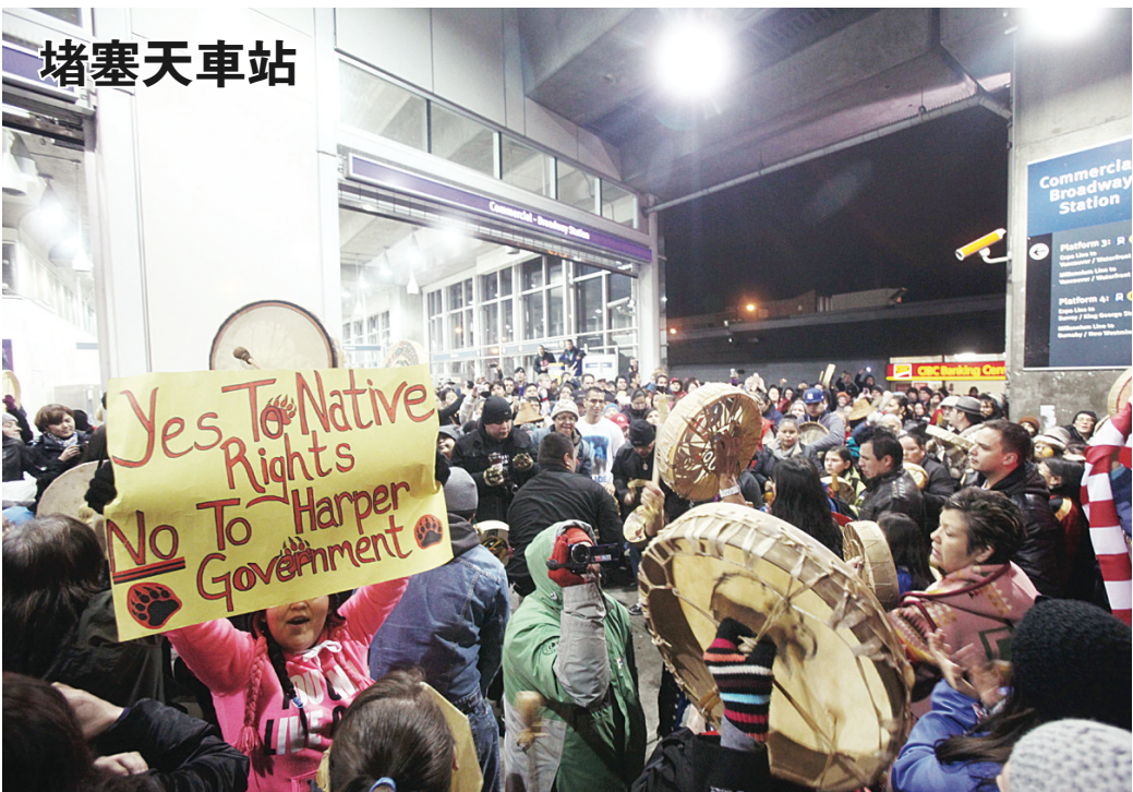
全國原住民抗議運動「不再懈怠」（Idle No More）持續升溫。數百名以原住民為主的抗議人士昨日傍晚6時開始堵塞其中一個最為繁忙的架空火車站商業—百老匯站（Commercial—Broadway）。