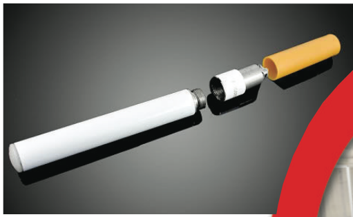
▲電子煙是一種類似筆狀的電子產品，內有小型電池及霧化器。 (網上圖片)