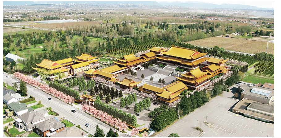
靈巖山寺擴建後的空照圖。

他解釋，根據法令，靈巖山寺不僅需要取得農業土地委員會的許可，也需要得到列市府的許可，缺乏當中任何一個，計劃均無可能推行。而他同意，如果靈巖山寺一開始已同時向農業土地委員會及市府提出各自相關申