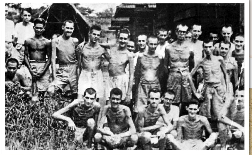
▲被日軍俘虜的加拿大軍人。