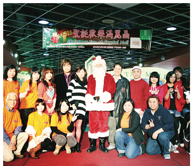
由威哥扮演的聖誕老人和工作人員合照。