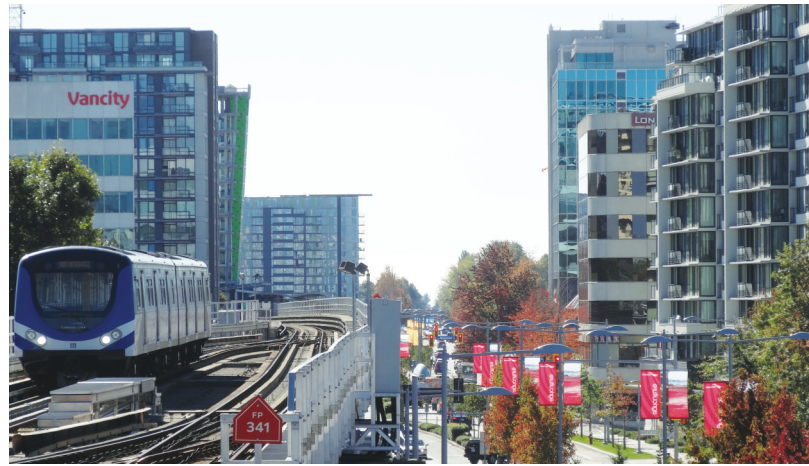
列治文今年第三季樓價上漲最多，達到20.2%。（資料圖片）

【明報專訊】卑詩省9月份由於買樓需求強勁，使得市場掛牌房屋數量降至8年來最低，9月住宅房屋銷售數量較去年同期增加12%，房屋中央放盤系統（MLS）平均住宅樓價達到60.52萬元，較去年同期增加5.3%。另根據Royal LePage的統計，今年第三季樓價上漲最多的是列治文，樓價漲幅達到20.2%。