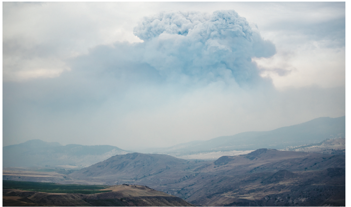
火積雲 卑詩內陸中部靠近阿什克羅夫特一處5000公頃面積的山火幾乎失控，圖為7月16日當地上空出現因山火而形成的火積雲。

* 患有哮喘或其他慢性病的人應確保他們有足夠的吸入器/藥物供應。 查詢詳情可瀏覽 https://www.emergencyinfbc.gov.bc.ca 。