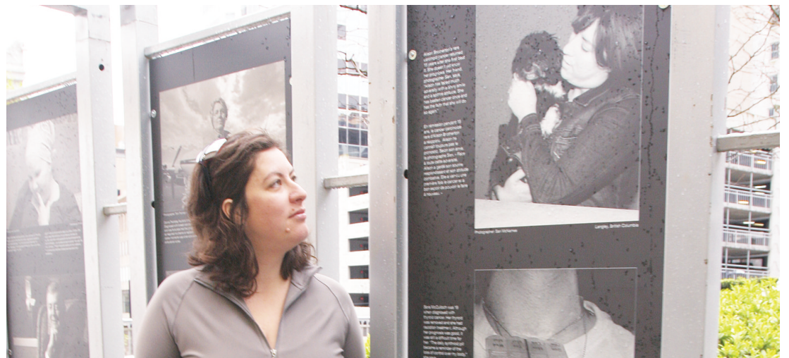
布拉澤頓觀看自己的照片。

希德在兩星期之前宣布辭去法務廳長職位，原因是皇家騎警對他在 2009 年 5 月省選期間的財政和宣傳，包括一張具有爭議性的中文宣傳單張進行調查。