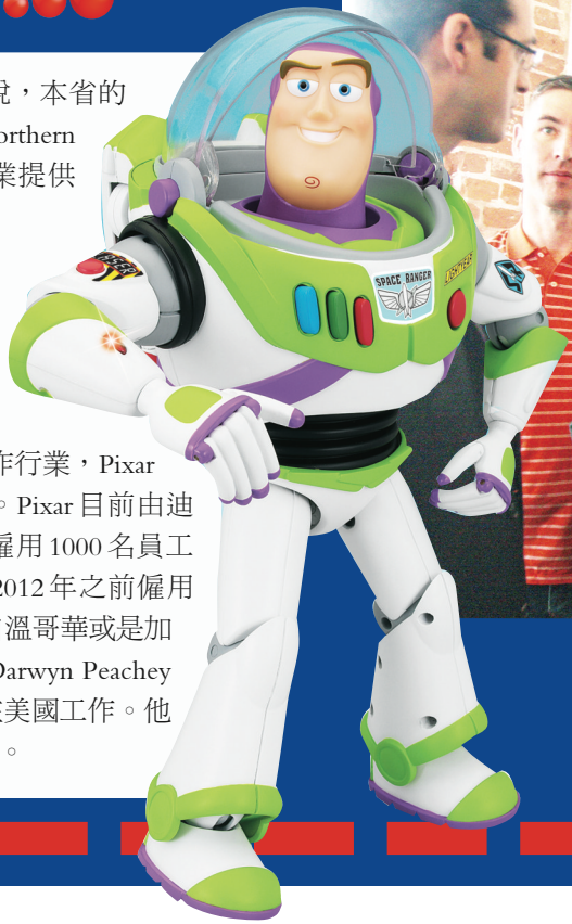
▲ Amir Nasrabadi (左起)、Dylon Brown、金寶爾、Darwyn Peachey，以及羅品信為製片廠揭幕。 ◀ Pixar 表示，溫哥華製片廠將利用 Buzz Lightyear 等卡通人物製作短片。 (網上圖片)

他指出，溫哥華的受僱人口中，3 分 1 來自創作行業，Pixar 到臨後，聲勢更加旺盛。Pixar 目前由迪士尼所擁有，在加州共僱用 1000 名員工。溫哥華製片廠打算在 2012 年之前僱用 75 人。但不一定是來自溫哥華或是加拿大。Pixar 的技術總監 Darwyn Peachey 指出，有不少加拿大人在美國工作。他們也很可能返回加拿大。