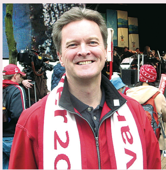
韓仕新指，將冬奧帶來的建設與機會，成為全省社區和商業的遺產，是卑詩省首要目標。

韓仕新強調，卑詩省商貿代表團在北京取得成功，希望將這股氣勢帶回卑詩省迎接2010冬奧。最重要是向世界展示，卑詩省是生活、工作、玩樂及投資的最佳地方。