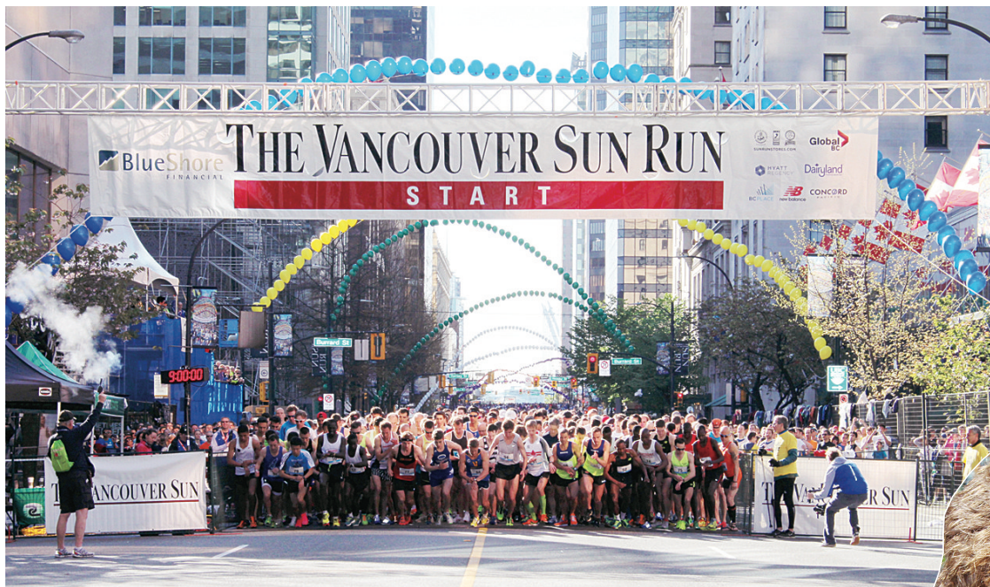
▲大批健兒奮勇一同起跑。