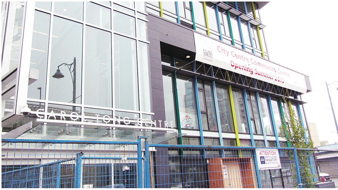
▲ Carol Tong Centre 的建造工程仍在進行中，設於大樓一樓及二樓的市中心社區中心，預期將於夏季正式啟用。

【明報專訊】列治文市內一所新社區中心將於今年夏季開幕，為區內的居民增加文娛活動空間。市府期望，新社區中心所提供的空間，能因應市中心一帶的人口增長所需，讓居民更易融入社區生活。