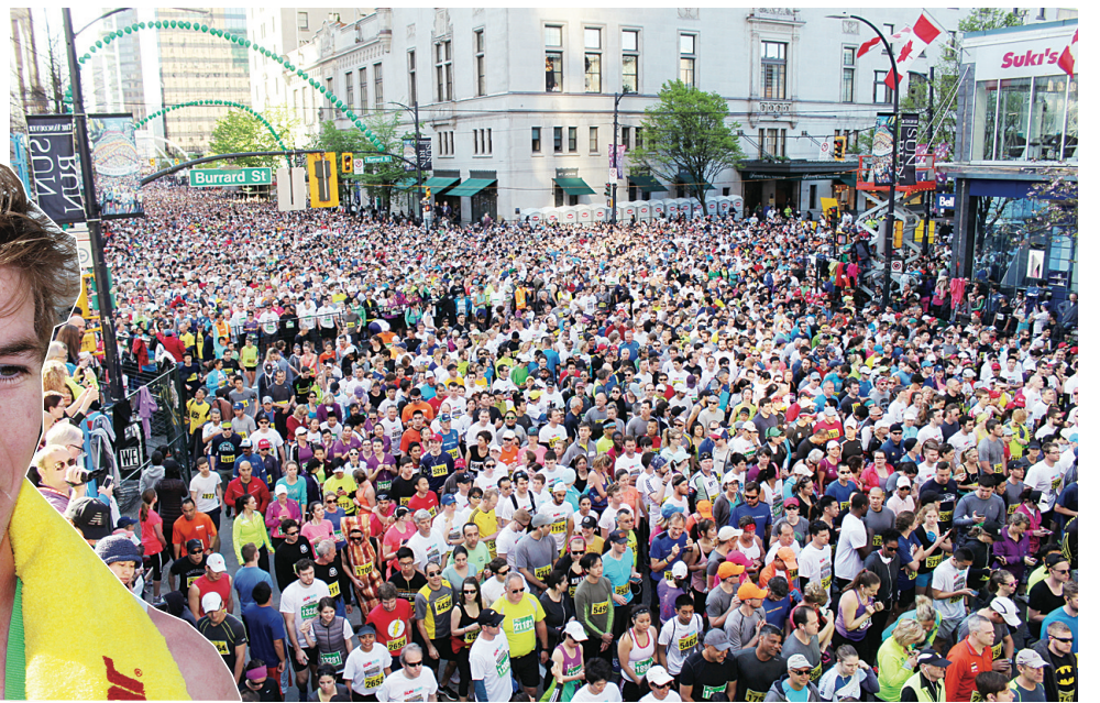
▲太陽長跑人山人海場面，有如城中嘉年華。

【明報專訊】溫哥華第31屆「太陽長跑」(Vancouver Sun Run)昨日早上舉行，有近4.1萬人參加。參加者包括來自加國各地的選手，亦有一些海外跑手，現場氣氛十分熱鬧，最年長的跑手達95歲。有華裔選手表示，「太陽長跑」更像城中嘉年華，而非僅是一項考驗毅力和耐力的長跑比賽。