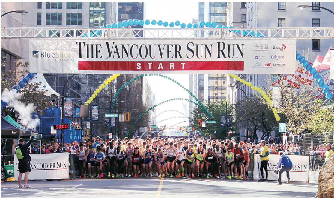
▲大批健兒奮勇一同起跑。