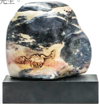
▲圖為冠軍獎品羅漢刻壽山石《任重道遠》薄意巧雕。

vip369@hotmail.ca，每人只限三聯，須具真實姓名及聯絡電話。截止收件日期為 4 月 30 日。查詢有關詳情，可致電 604-803-0369 陳先生。