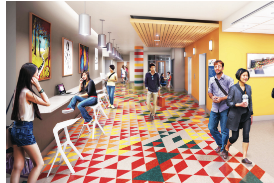
▲▼ 列治文市中心社區中心的內部設計圖片。