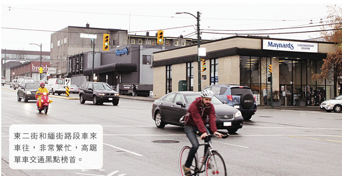
東二街和緬街路段車來車往，非常繁忙，高踞單車交通黑點榜首。

據溫哥華市政府的一份數據顯示，市內每日平均有 6 萬人騎單車代步，有 3500 名騎單車人