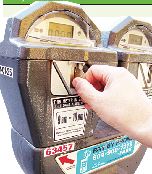
溫市擬加裝停車咪表增加收入。(資料圖片)

此宣傳片將會陸續推出多種譯本，目前國粵英版本已製作完畢，如欲查詢更多詳情，可瀏覽網址：www.vgh.ca。