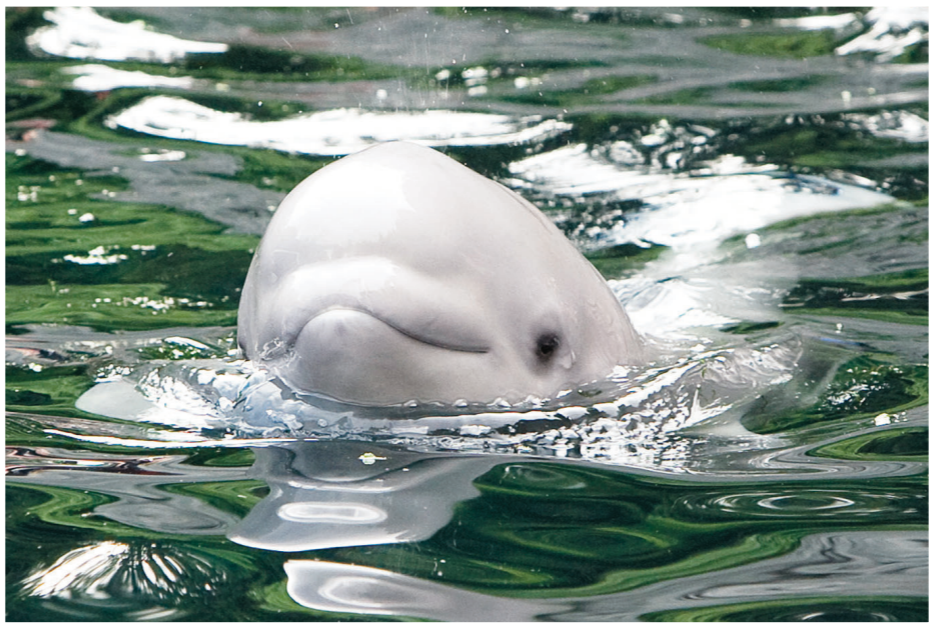
▲小白鯨前兩天身體不適，經過治療之後，已逐漸好轉。 ▶小白鯨恢復狀態後，可以再與母親在水中嬉戲。(資料圖片)

這條在6月10日出生的小白鯨還沒有名字，水族館歡迎所有省民為白鯨寶寶起名字。小白鯨出生後，水族館的遊客明顯增加，許多遊客都是為了看小白鯨而來，牠在短絲的兩星期之間，就有了不少「粉絲」，水族館對小白鯨採取全天候24小時照顧，連小白鯨在水中「上廁所」的動作，都有專家監視。