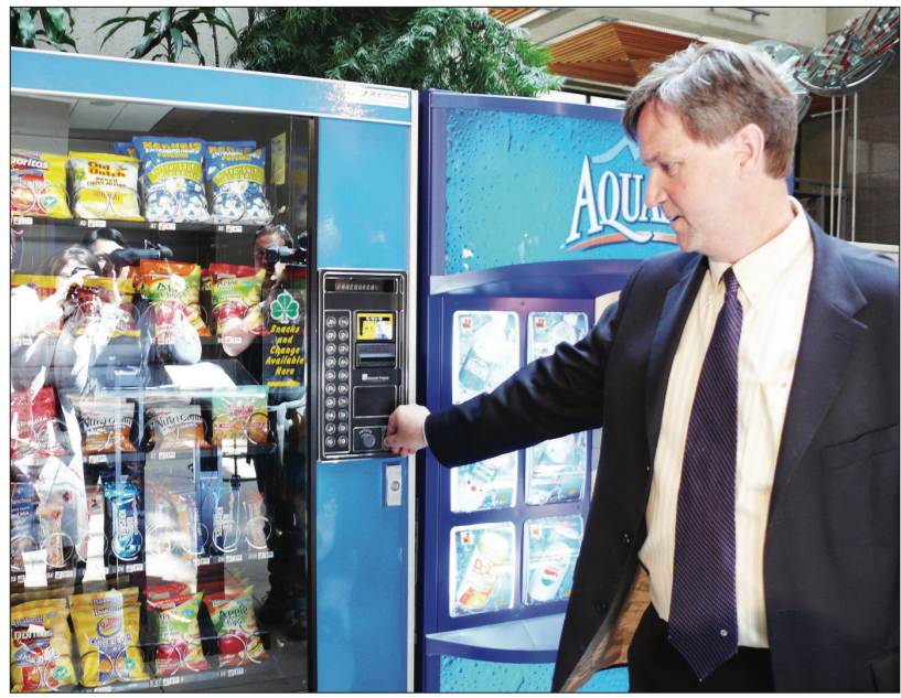
衛生廳長卜佐治宣布，溫哥華沿岸衛生局轄下各機構內的自動販賣機，將全部改賣健康食品及飲料，他以身作則買了一袋水果乾。