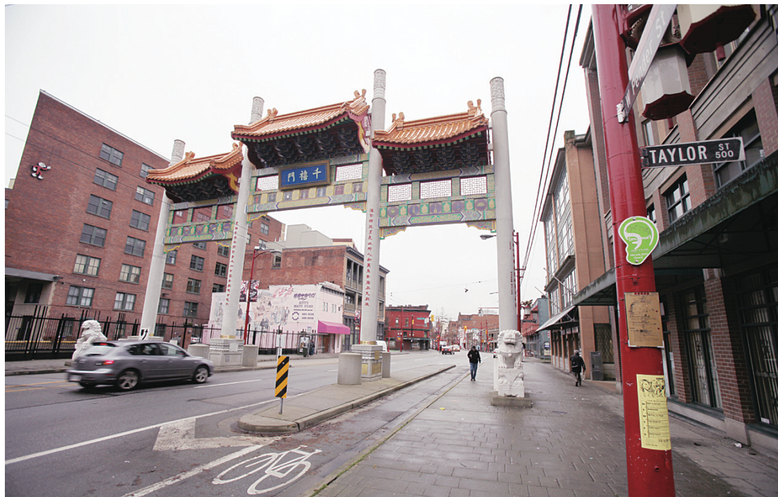
蛇年華埠春節大遊行啟步點靠近千禧門。