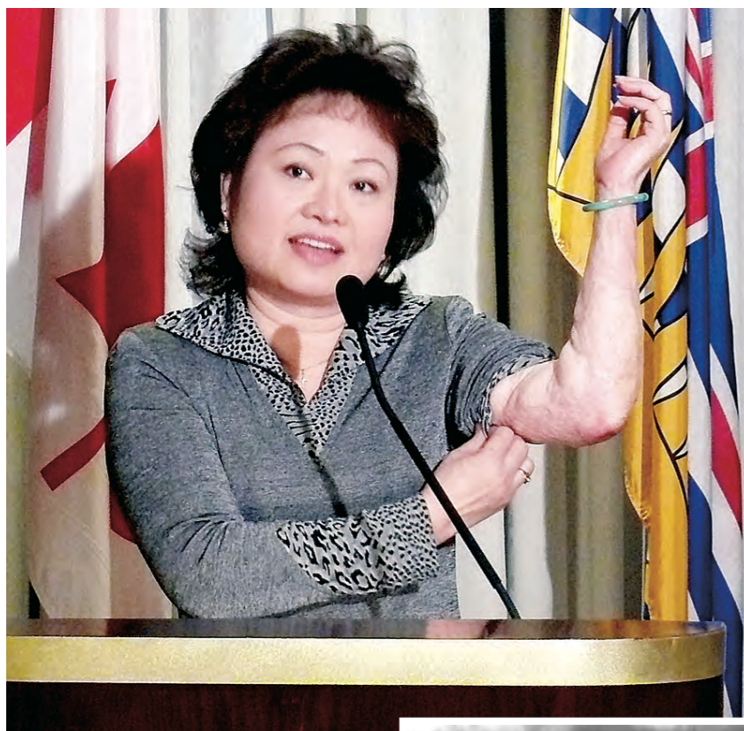
▲在越戰中遭受3級程度燒傷的Kim Phuc向記者展示她遍布疤痕的手臂，以自己的經歷鼓勵燒傷患者重建信心。 ▶當年9歲的Kim Phuc在越戰中嚴重燒傷，此照片讓她成為世界著名的燒傷倖存者。