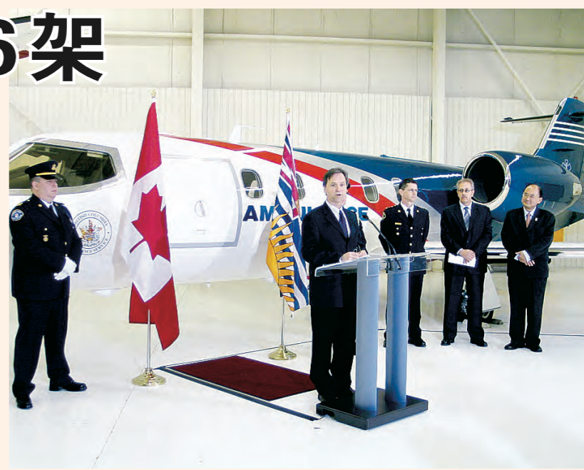
省衛生廳長卜佐治宣布新合約，身後是一架噴射救護飛機。

目前，卑詩省救護服務協會的救護飛機隊共有6架飛機，其中一架為噴射機，其餘5架是螺旋引擎飛機，另外還有3架救護直升機，新增的一架飛機屬於螺旋引擎飛機。