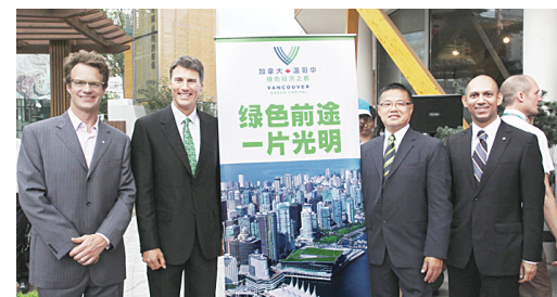
溫哥華市長羅品信(左2)及溫哥華市議員雷健華(右2)出席了「溫哥華綠色經濟日」活動。

至於在昨日下午迎來第50萬名旅客的慶祝儀式,羅品信說,目前每年自中國到溫哥華的旅客人數達到10萬人,光是在2010年即將增長10%,今年加中兩國簽署指定旅遊目的地國家(ADS)協議後,預計將帶來更大量