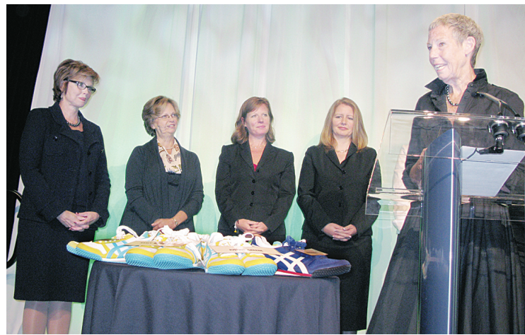
格林(右一)演講得到包括前財政廳長泰萊(後排左1)等政商界名人的支持。