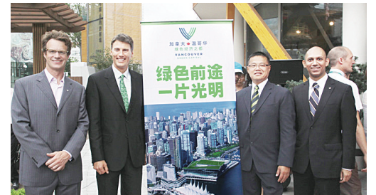
溫哥華市長羅品信(左2)及溫哥華市議員雷健華(右2)出席了「溫哥華綠色經濟日」活動。

至於在昨日下午迎來第50萬名旅客的慶祝儀式,羅品信說,目前每年自中國到溫哥華的旅客人數達到10萬人,光是在2010年即將增長10%,今年加中兩國簽署指定旅遊目的地國家(ADS)協議後,預計將帶來更大量