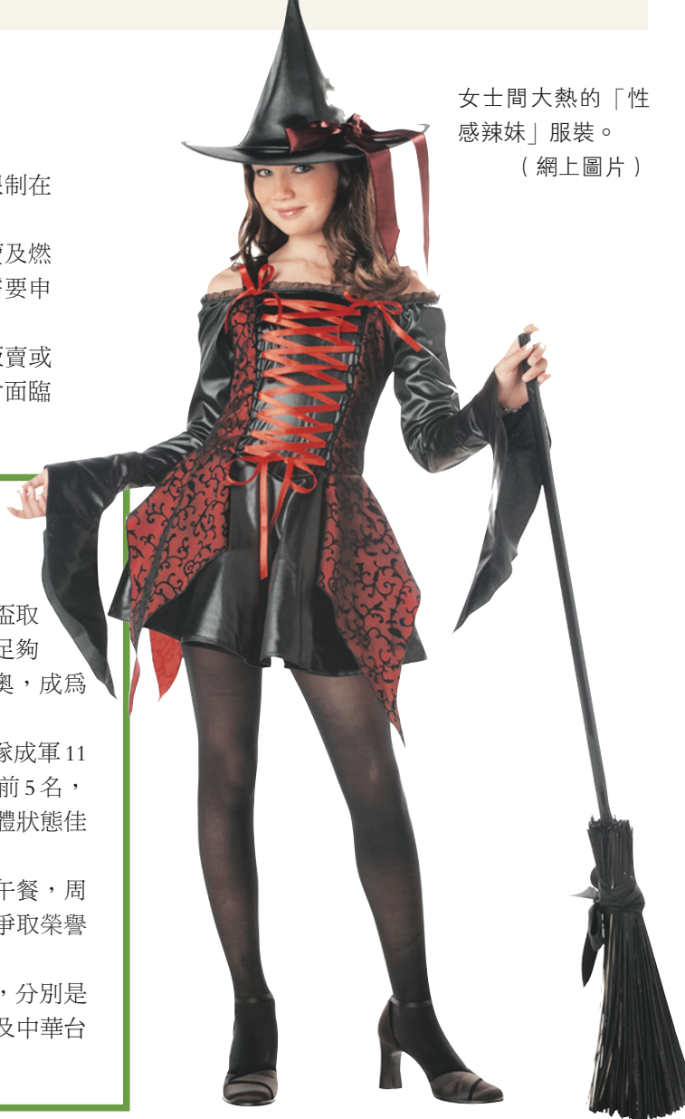
女士間大熱的「性感辣妹」服裝。 (網上圖片)

其餘包括列治文、高貴林、素里等市，販賣或是燃放煙花皆屬違法，情況嚴重時更可能會面臨罰款。