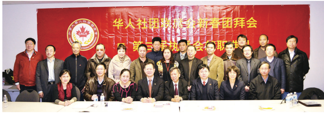
華人社團聯席會新年團拜合照。