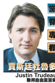
賈斯廷杜魯多 Justin Trudeau 聯邦自由黨黨領

前幾天哈珀總理在國會提出延長並加深加拿大在伊拉克戰爭的參與，並將戰鬥行動延伸至敘利亞。也就是說最初 30 天的「顧問及輔助」型非戰鬥性任務在延長六個月後，現在加拿大部隊還要繼續在前線戰鬥。