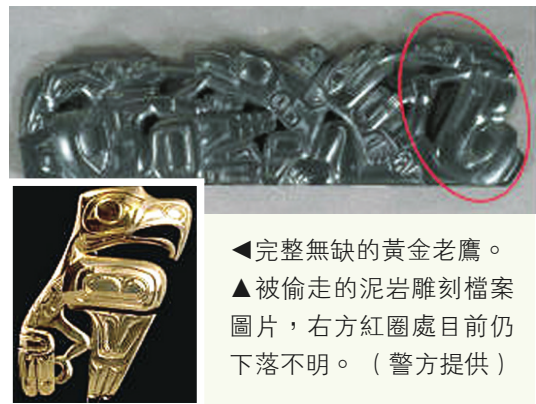
▲完整無缺的黃金老鷹。 ▲被偷走的泥岩雕刻檔案圖片，右方紅圈處目前仍下落不明。

狄德安呼籲省府盡快完成自從2006年已開始的撥款檢討工作，為本省約5,000名患有1型糖尿病症的病童提供多一個治療選擇。省衛生廳表示，相關檢討預料秋季會有結果。