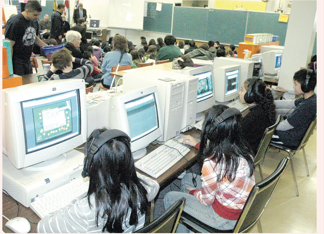
學生示範新遊戲的玩法。

溫哥華教育局先前曾經與 LiveWires 合作，開發互聯網安全遊戲《失蹤》(Missing)，已經發行12個國家，接觸到500萬名學生。