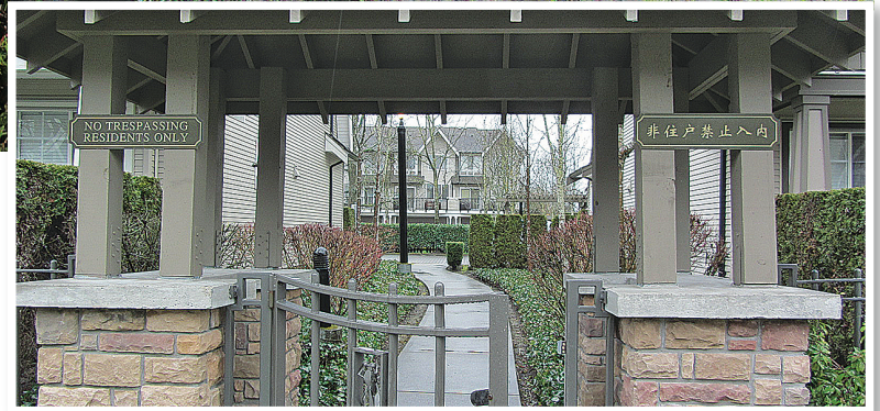
卑詩人權仲裁處已受理 Wellington Court 城市屋屋苑業主提出的投訴。

一位不願透露姓名、居於該城市屋屋苑的華裔業主表示，她本人是移民，懂英語和國語，但認為：「加拿大始終是說英語的國家，正式的場合比較適合用英語，這是基本尊重。小孩子即使是以中文為母語，在學校也是學英語、說英語。」 她贊成用英語作為主要溝通語言，不過認為，業主立案法團可以將一些重要文件翻譯成中文及在會議上提供國語翻譯解決現時的問題。她說：「我不希望法團和業主為這個事情打官司，因為這樣既要花錢，而且對雙方都沒有好處。」