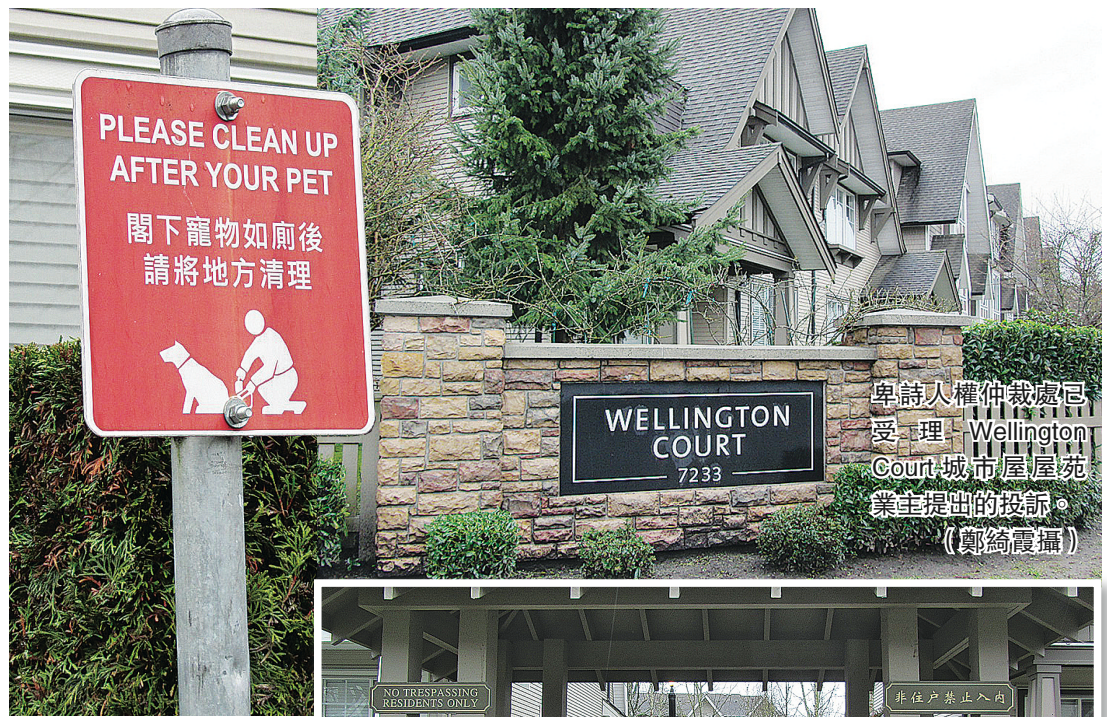
▲屋苑內的部分告示都附有中文翻譯。 (鄭綺霞攝) ▶屋苑開門兩邊分別掛上中英文版告示。 (鄭綺霞攝)

他表示，作為屋苑的物業管理公司，他們希望能作為橋樑，加強各方面的溝通，並說現時有關投訴會由法團的保險公司跟進。