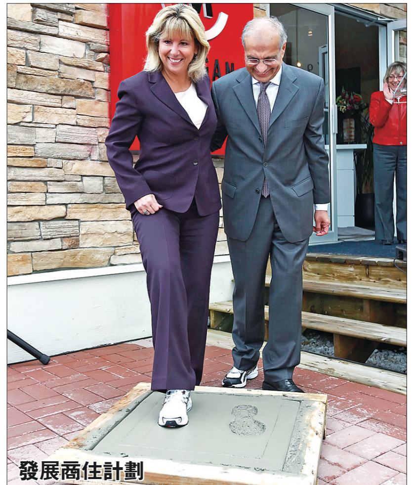
發展商住計劃 素里市長沃茨(Dianne Watts)昨日在一塊預製水泥板上，印下腳印，標誌着由公司 Larc Investments 在素里發展的 Morgan Crossing 商住兩用計劃，進入另一期工程。Morgan Crossing 將集居住、購物、飲食及文娛康樂於一處，商店都在步行可及的範圍之內。