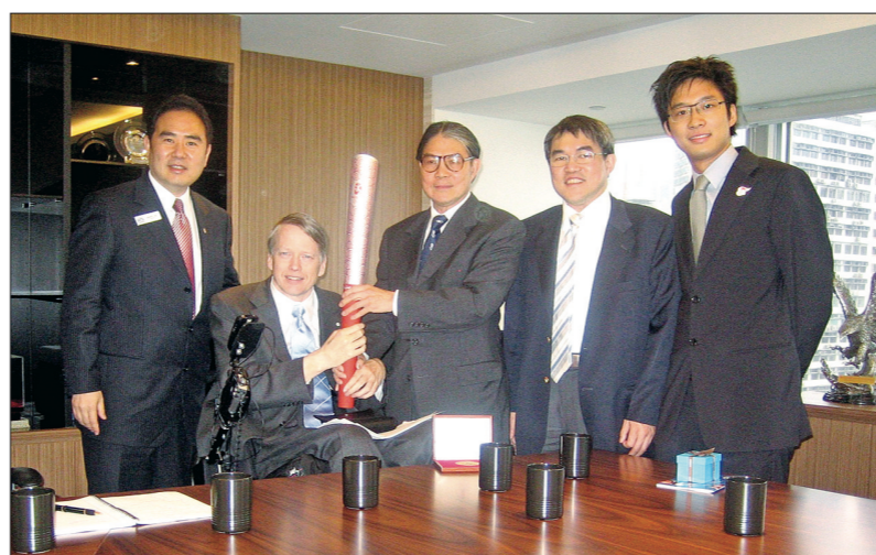
左起：李敬成、蘇利文、中國香港體育協會暨奧林匹克委員會主席霍震霆、霍英東集團公司董事霍震宇及副總裁霍啟山。蘇利文手持的是2008北京奧運聖火傳送活動中用到的火炬。