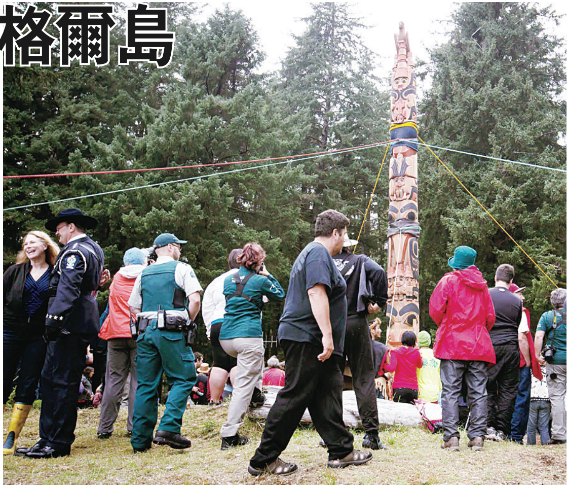
民眾觀看豎立萊爾島上13米高的圖騰。