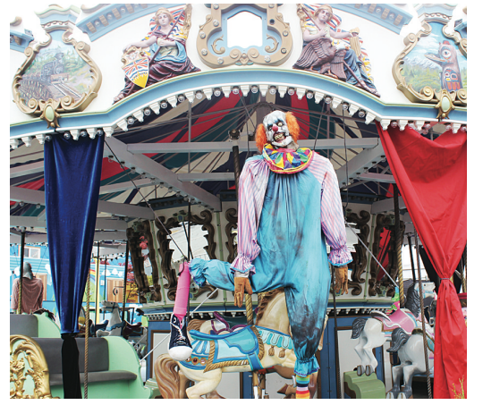
旋轉木馬也掛上鬼小丑。