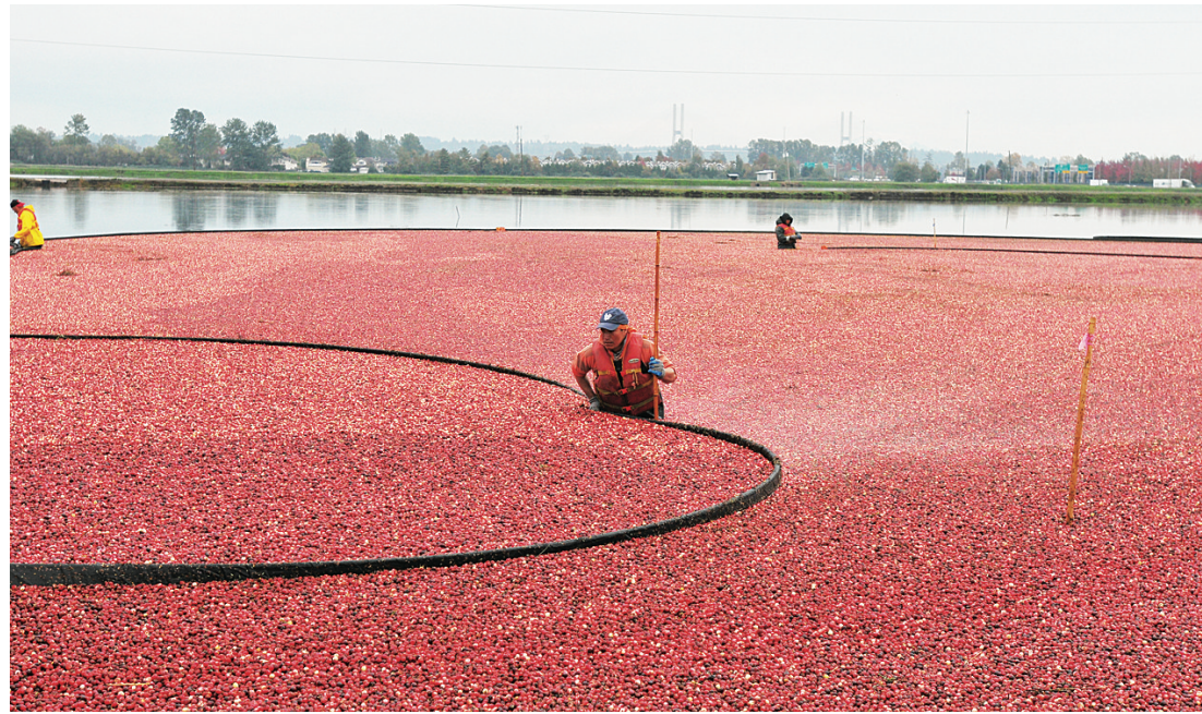
工人將浮在水面的蔓越莓收集到一起。

她表示，曾被暴力、疏忽和貧窮而受到傷害的兒童及家庭，與政府做得不足有關，但這些過失和結果並非其部門漠不關心所致。