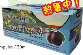
12 Ampoules / 20ml

【作用機轉】 ● 自然界食物中以黑色最好，其營養成分排列以黑色最佳，其次是紅色、橘色、黃色等。 ● 大棗含豐富維生素C 有極強的抗氧化活性，能促進膠原蛋白合成的作用，充足的維生素C 能促進生長發育，增強體力和減輕疲勞。 ● 含補血因子：鐵；對貧血、血小板減少有效，如：病中病後、手術中、孕婦補血、產後調養。 ● 含鈣、鎂、鉀對老人骨折、骨質疏鬆、心肌無力、腎炎、乏力、失眠、糖尿病患者有效。