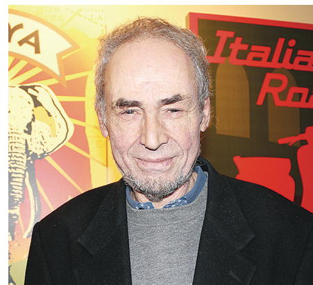
▲卑大經濟系紐曼致力於推廣社區對古典音樂文化的認識。