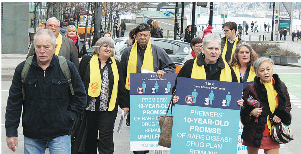
多名CORD成員及支持者在市中心高舉標語遊行。