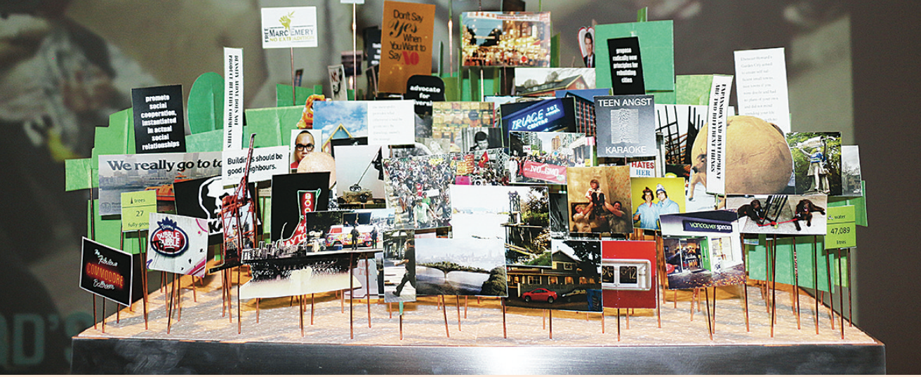
▲展覽向人們展示溫哥華生活元素。