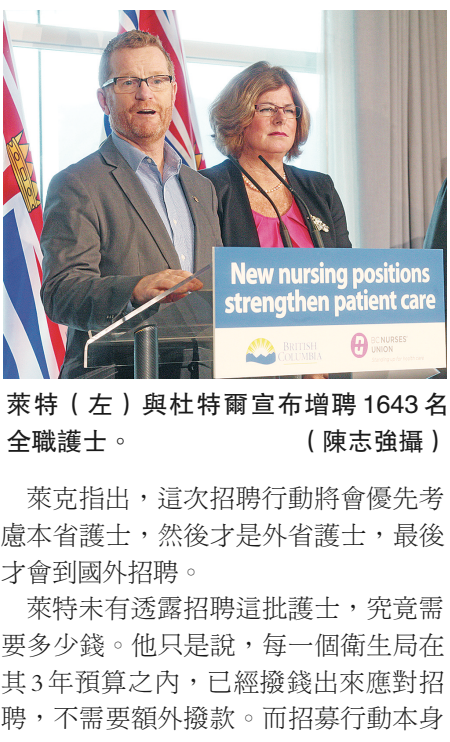
萊特(左)與杜特爾宣布增聘1643名全職護士。

【明報專訊】省衛生廳昨日宣布，將在3月31日之前，增聘1643名全職護士，估計大部分名額能夠從現有兼職護士中補上。 卑詩省衛生廳長萊克(Terry Lake)昨日連同卑詩護士工會(BCNU)總裁杜特爾(Gayle Duteil)一同作出上述宣布。除了省府與工會之外，省下屬各衛生局、卑詩醫療僱主聯會(Health Employers Association of BC)都有參與招聘。 杜特爾指出，本省護士短缺的情況十分嚴重，不少護士要輪班16個小時，急症室及手術室經常沒有足夠護士值班。杜特爾相信，在不到三個月的時間聘用1600多名護士，不會有太大困難。因為目前約有7000名護士以兼職的形式應聘，下班後又會從事護士以外的工作以維持生活，償還學生貸款，她有信心不會出現求過於供的現象。