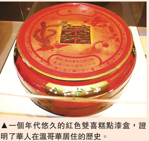
▲一個年代悠久的紅色雙喜糕點漆盒，證明了華人在溫哥華居住的歷史。

【明報專訊】一個旨在啟發人們對未來城市生活空間進行思考和創新的「你未來的家：創建新的溫哥華」(Your Future Home: Creating the New Vancouver)展覽將於明日在溫哥華博物館(Museum of Vancouver)開幕，主辦方通過展示20位著名建築設計師及城市規劃師等的研究結果和設計，令人們更加了解溫哥華這個城市，並積極參與共同尋找未來解決方案。