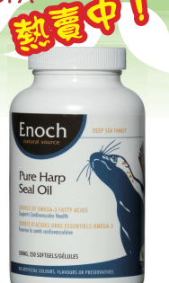
NPN 80047344 250 Softgels / 1000mg NPN 80023120 250 Softgels / 500mg

【作用機轉】 ● 實驗證實 Ω3 在懷孕時可預防：因懷孕引起的高血壓、延長懷孕期、增加體重和減少早產兒的發生率。 ● 一份英國研究報告稱 80% 以上精神分裂症的患者都缺乏 Ω3，沮喪和精神衰弱與 Ω3 的不足有關係。 ● Ω3 油酸可以緩解過敏、氣喘症及自體免疫疾病 (紅斑性狼瘡、類風濕性關節炎、乾癬) 所引起的發炎症狀。 ● 其他可改善的症狀：經痛、阿茲海默症、過動症及精神不能集中 (ADHD)。