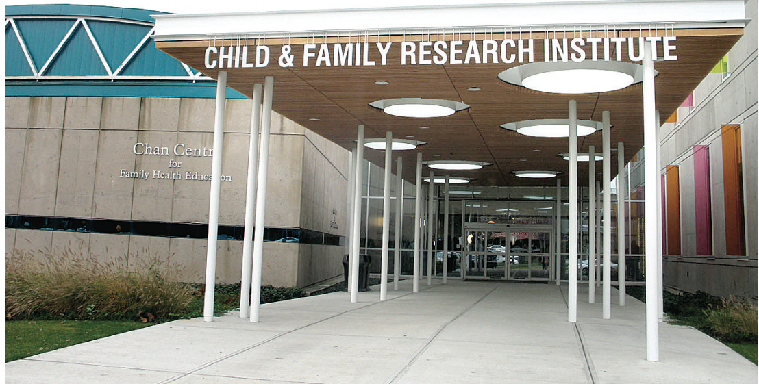
5層高的卑詩兒童與家庭醫學研究所大樓昨日落成啟用。

【明報專訊】卑詩省兒童與家庭醫學研究所（Child & Family Research Institute）大樓昨日正式落成，研究所大樓位於卑詩兒童醫院內，面積達12.1萬呎，共花費5810萬元興建，將吸引來自世界各地在兒童糖尿病、傳染病、免疫疾病、精神病及癲癇等領域醫學研究人員前來，提高卑詩省在兒童醫學研究領域的競爭力。