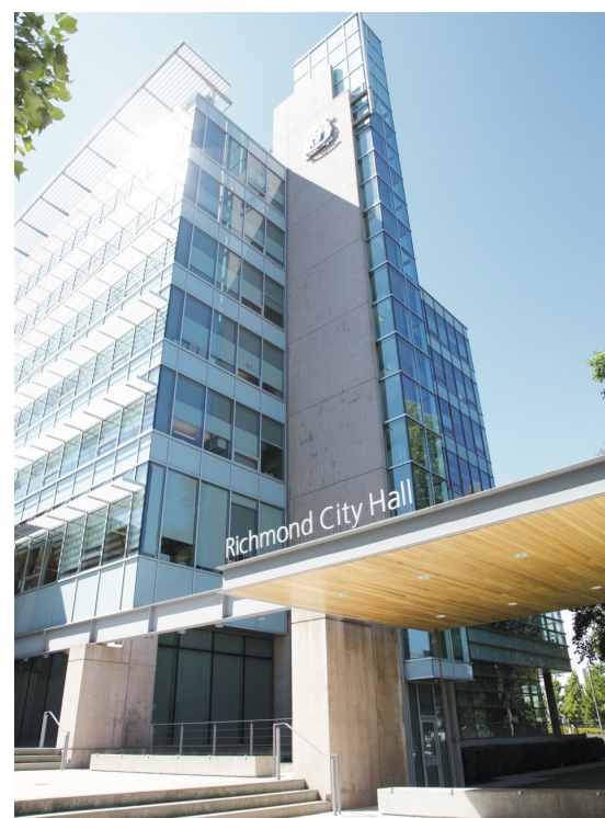
市民到列市府交水費地稅，可以手機繳付。

其他新設的工具有助尋找市內託兒設施的Child Care Finder搜尋器和藏有2100張數碼圖片