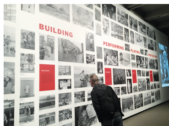
參觀者細看70年代的照片。

70年代的過來人。有人看到自己感興趣的題目，會俯身貼近觀看細小的文字解說，看過明白。該展覽是建基於《溫哥華太陽報》的退休圖書館管理員Kate Bird所撰寫的一本照片集；書名也是Vancouver in the Seventies。該書剛於10月15日出版。她指出，這批圖像不僅反映出溫哥華市當年的風格，也顯示今天的溫市如何奠定基礎。