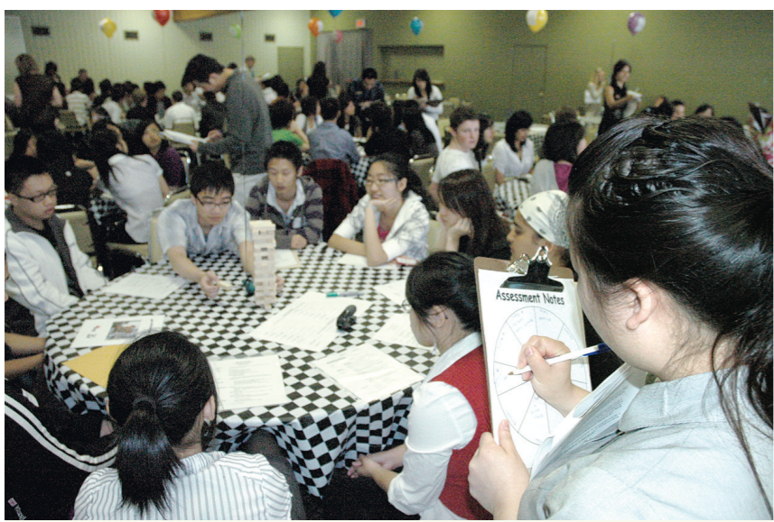
PNE通過玩遊戲面試應徵者。

5幢傳統建築物的維修及翻新工程預算將於6至8個月完成，僑團代表需要於今年年底向市議會匯報工程進度。