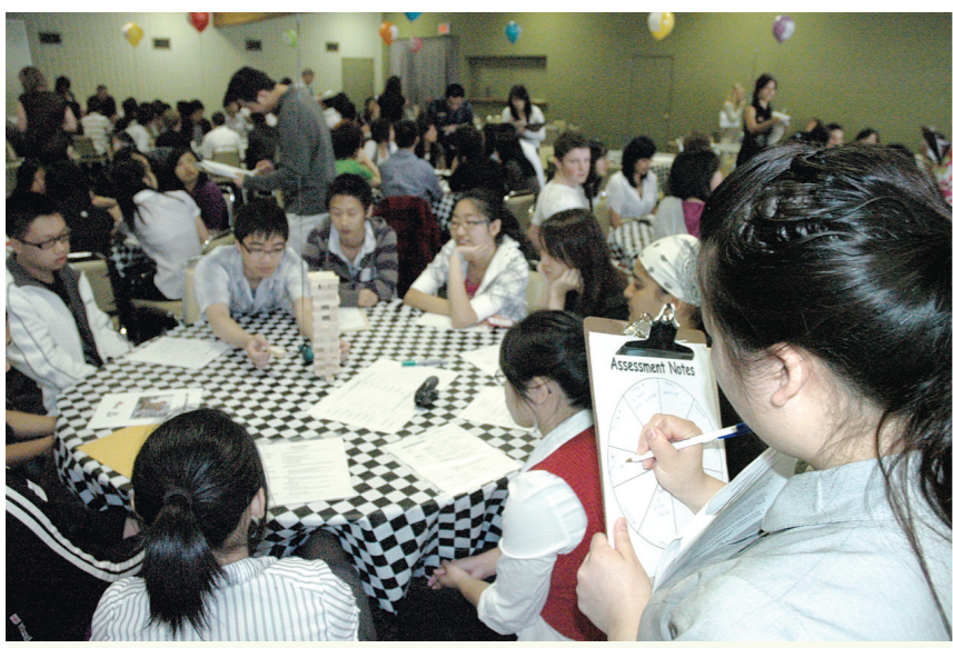
PNE通過玩遊戲面試應徵者。

5幢傳統建築物的維修及翻新工程預算將於6至8個月完成，僑團代表需要於今年年底向市議會匯報工程進度。