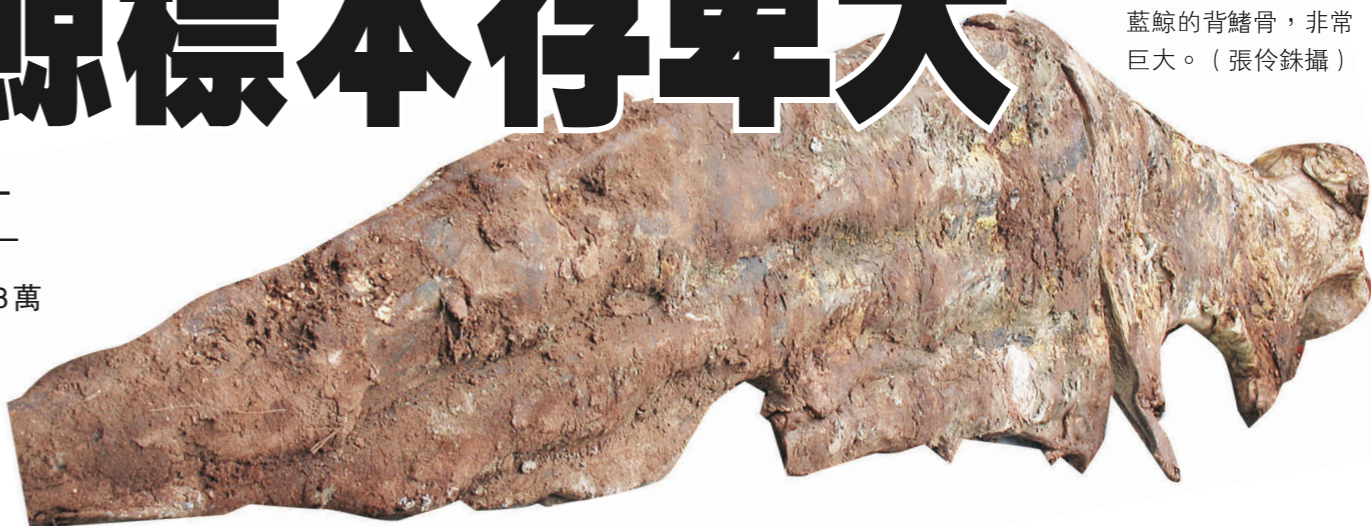
藍鯨的背鰭骨，非常巨大。

特里特斯是卑詩大學生物多元研究中心的研究員，也是 UBC 海洋生物研究單位的主任，是他一手主導挖掘該條藍鯨的骸骨及處理工作