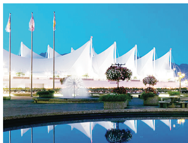
加拿大廣場著名的「5帆」屋頂將會換新。(加拿大廣場網站圖片)

他亦透露，市府負責研究推廣城市可持續性的小組，正在研究如何吸引更多家庭使用太陽能等清潔能源，擬與卑詩太陽能協會合作，推出相關優惠政策。