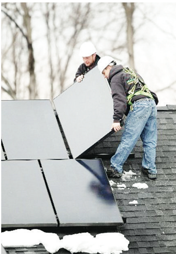
安裝太陽能面板的屋頂必須經過改造，增加其承受負荷的能力。

【明報專訊】為鼓勵更多家庭應用太陽能，以減少非再生資源消耗及溫室氣體排放，列治文市府有意引入新條例，規定承建商未來在興建獨立屋時，必須在施工時設置好管道及電源線路等，並增加屋頂承重設計，以便能最大程度地方便住戶安裝太陽能熱水系統。