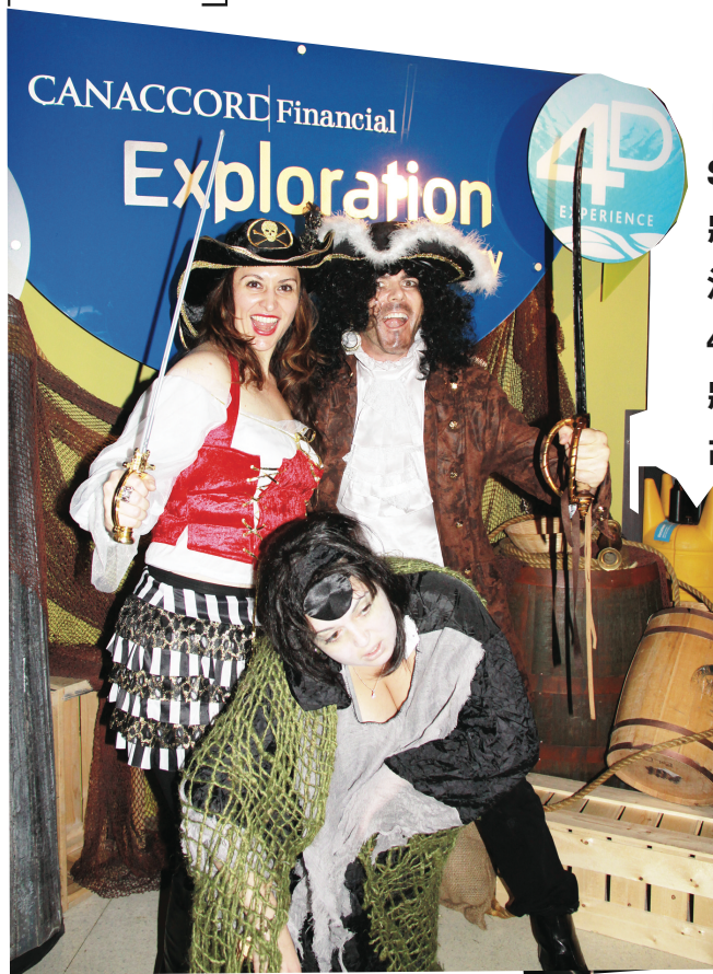
▲▶工作人員扮成海盜與小朋友同樂，萬聖節氣氛十足。同時特備海洋動物骨骼展。

【明報專訊】溫哥華水族館從明日起至31日，將舉行Spooky Seas萬聖節特展。活動期間館內將佈置如同鬼屋一樣，展示各種海洋生物骨骼，並放映特製的萬聖節4D電影，打扮成海盜的解說員還將與小朋友分享卑詩沿海的沉船鬼故事，非常適合親子同樂。