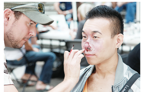
化妝師們現場展技藝，創造一個個爛臉血腥形象。

只是路過的華裔留學生林女士則說，突然看到這麼多形象逼真的喪屍在一起張牙舞爪，心裏難免會有點發毛，不過還好是大白天，如果換成晚上只怕要被嚇哭。