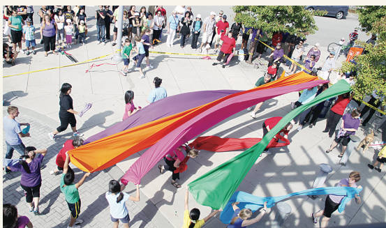
舞者突然在史蒂夫斯頓村漁人碼頭跳起彩帶舞，給市民意外驚喜。

【明報專訊】列治文藝術中心(Richmond Arts Centre)昨日舉行了3場別開生面的「快閃族」(Flash Mob)表演，數十名舞者在市內知名景點突然出現，表演短暫的團體舞蹈後隨即一哄而散，且行程完全沒有預告，以驚喜又意外地將藝術帶入民衆生活。