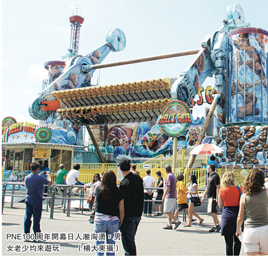
PNE100周年開幕日人潮洶湧,男女老少均來遊玩。