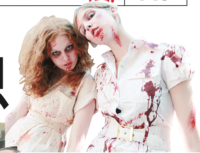
▲少女們血淋淋的喪屍扮相，大白天都令人「毛骨悚然」。