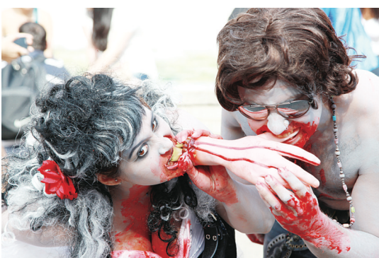
▲食人的恐怖情節，也是「喪屍」必備。