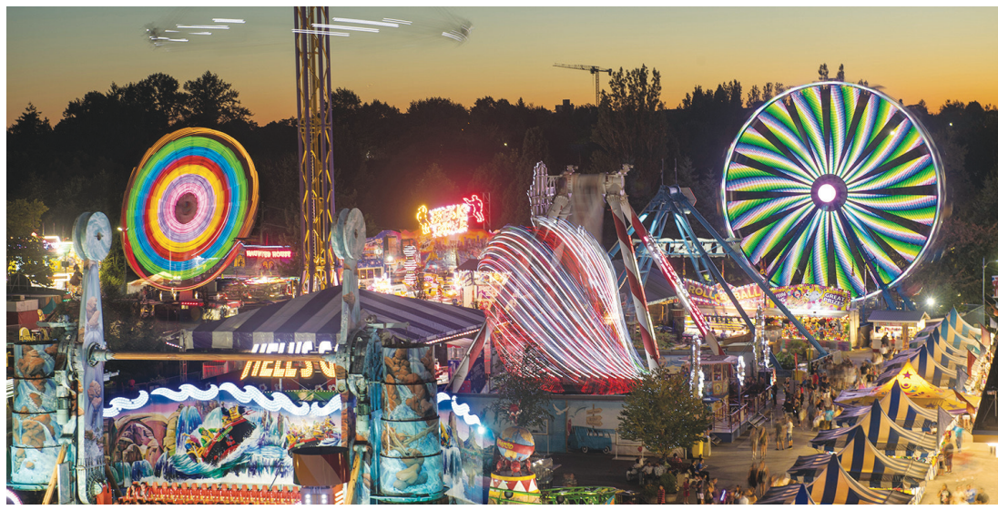
PNE昨日公布，機動遊樂場Playland定於6月11日(下周五)晚上重開。

主辦機構昨日強調，Playland仍以安全為首要要務，「我們將以顯著減少的容納人數重開」。機構亦指，入場民眾需保持身體距離，場內會加強清潔，乘坐機動遊戲時、於遊戲區內和排隊時都要戴有口罩。 PNE表示，容納人數有限，因此所有入場民