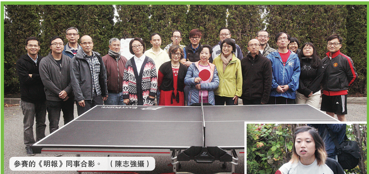
參賽的《明報》同事合影。