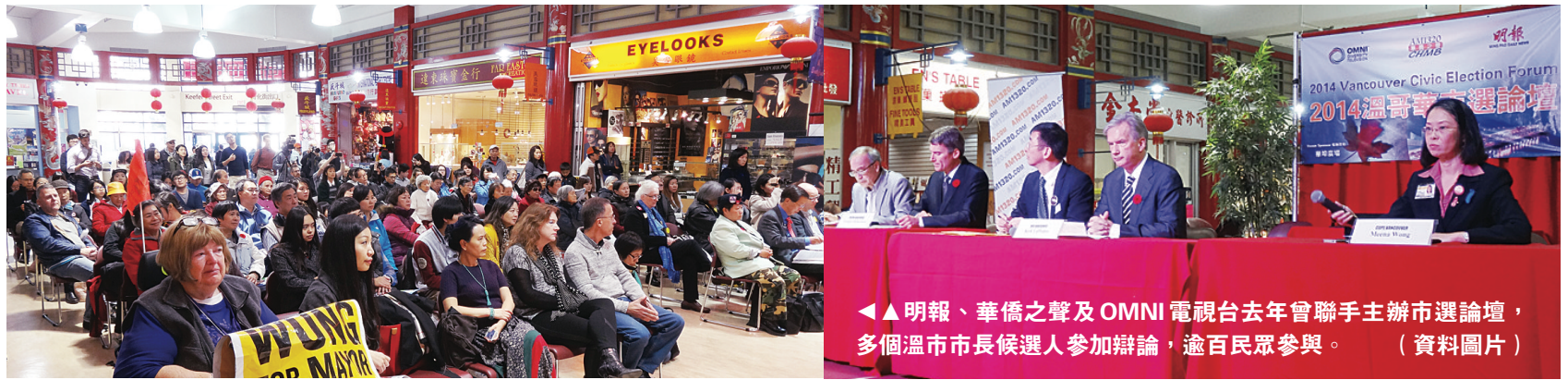
◀▲明報、華僑之聲及 OMNI 電視台去年曾聯手主辦市選論壇，多個溫市市長候選人參加辯論，逾百民眾參與。(資料圖片)

【明報專訊】明報、華僑之聲及 OMNI 電視台將於今明兩天舉辦兩場大選論壇，四個聯邦政黨，包括保守黨、新民主黨、自由黨及綠黨將會派出候選人，參加辯論及回答提問。